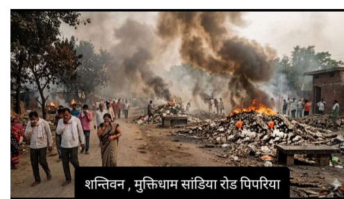
शान्तिवन, मुक्तिधाम सांडिया रोड पिपरिया

पिपरिया में सांडिया रोड स्थित मुक्तिधाम ( शांतिवन ) मछवासा नदी के किनारे है। नगर भर का कचरा यहां डंप किया जाता है। कचरे में प्लास्टिक और पॉलीथिन बड़ी मात्रा में होती है। इस कचरे का आग लगाकर नष्ट करने का प्रयास किया जाता है जिसके कारण कई समस्याएं सामने आ रही है। कचरे के जलने के बाद उठा जहरीला धुंआ कई बीमारियों का कारण बन गया है। तीन वार्डों के निवासियों पर इसका प्रत्यक्ष प्रतिकूल असर अशोक वार्ड, राजेन्द्र वार्ड, महाराणा प्रताप वार्ड पर पड़ रहा है।